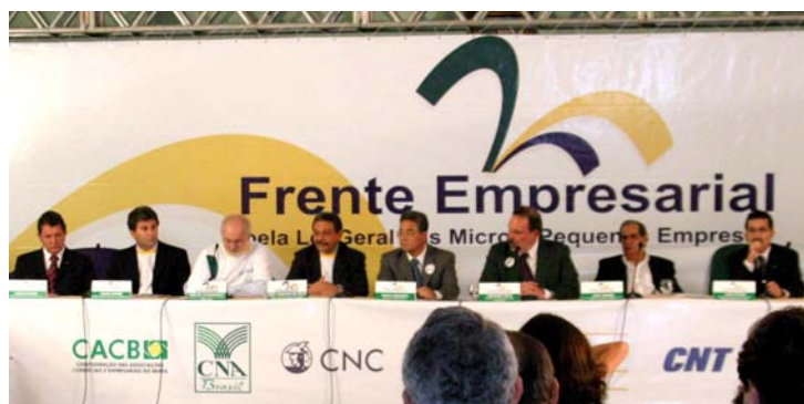
Lançamento da Frente em Manaus