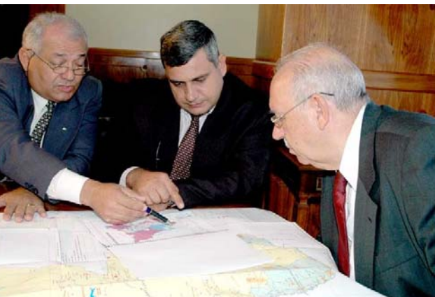
José Alencar, Ministro da Defesa (dir), em reunião com presidente da FACIR