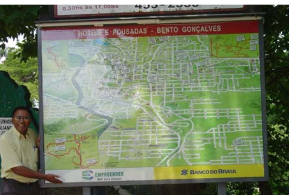
José Odenir Rodrigues, coordenador do Empreender pela Federasul

O Empreender planeja duplicar suas ações, no Rio Grande do Sul, em 2005. O programa prevê a expansão do projeto de 57 para 100 municípios. O bom desempenho do Empreender deve-se a dedicação de seus integrantes, atuação dos facilitadores e, também, determinação de atingir bons resultados. Em Bento Gonçalves, por exemplo, as atividades do Empreender estão voltadas para mais