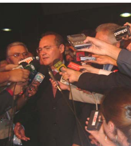
Presidente do Senado Federal, Renan Calheiros, fala sobre o Manifesto contra a MP 232

No dia 17 de fevereiro, representantes de mais de 300 entidades de todos os setores econômicos estiveram presentes no Congresso Nacional para mostrar a indignação com o governo pela publicação da MP 232 e pedir sua rejeição na Câmara dos Deputados e no Senado Federal. A comitiva da Frente Brasileira contra