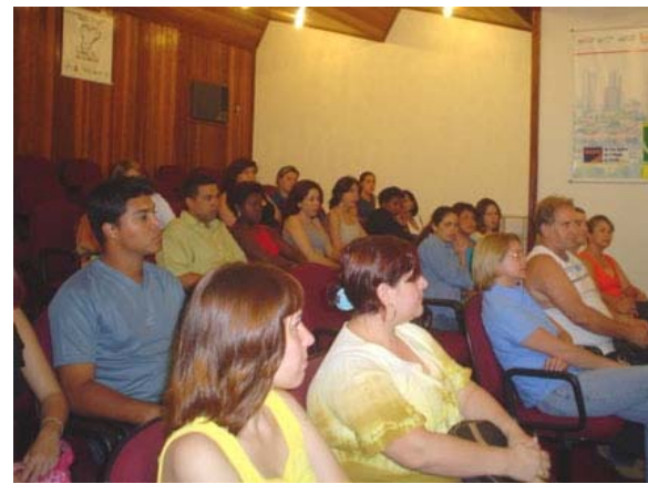
Reunião na sede da ACE de Marília